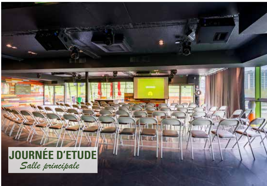
JOURNÉE D'ETUDE Salle principale

La Turtle accueille le vestiaire - elle est uniquement utilisée comme back up en cas de mauvais temps.