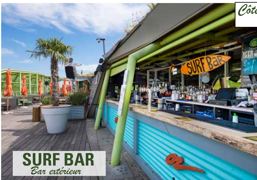
SURF BAR Bar extérieur