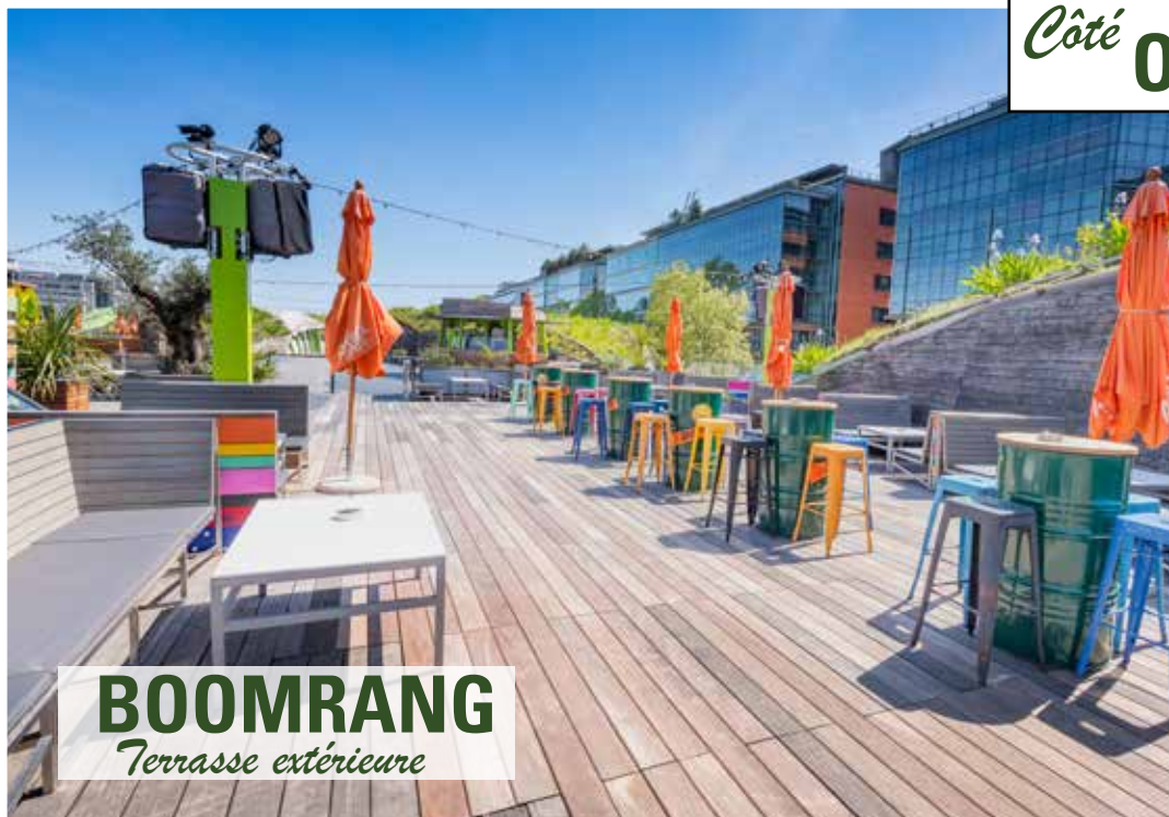
BOOMRANG Terrasse extérieure