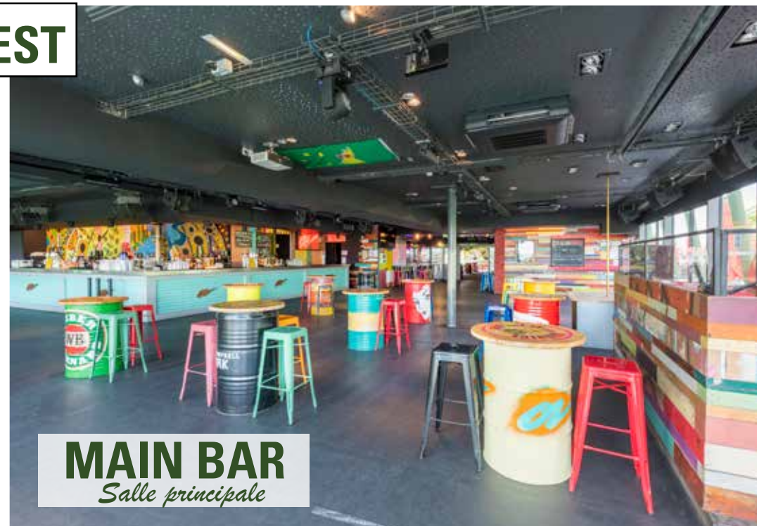
MAIN BAR Salle principale