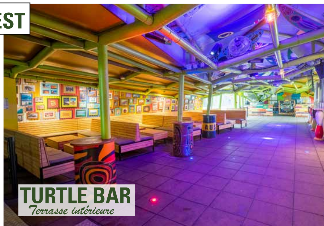
TURTLE BAR Terrasse intérieure