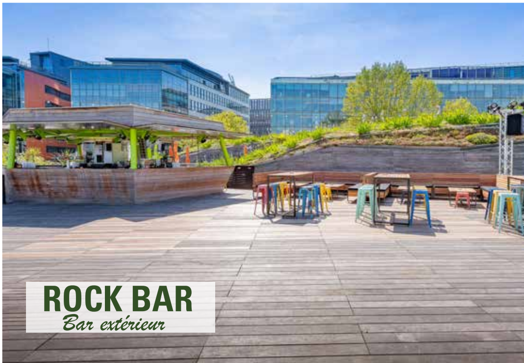
ROCK BAR Bar extérieure

Le Rock Bar ouvert d'avril à octobre 60 à 200 pax en cocktail 230 m 2 - espace modulable