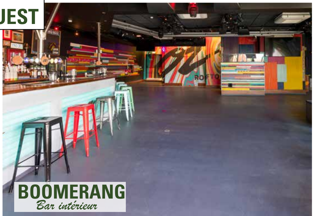
BOOMERANG Bar intérieur