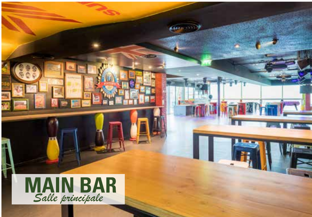
MAIN BAR Salle principale