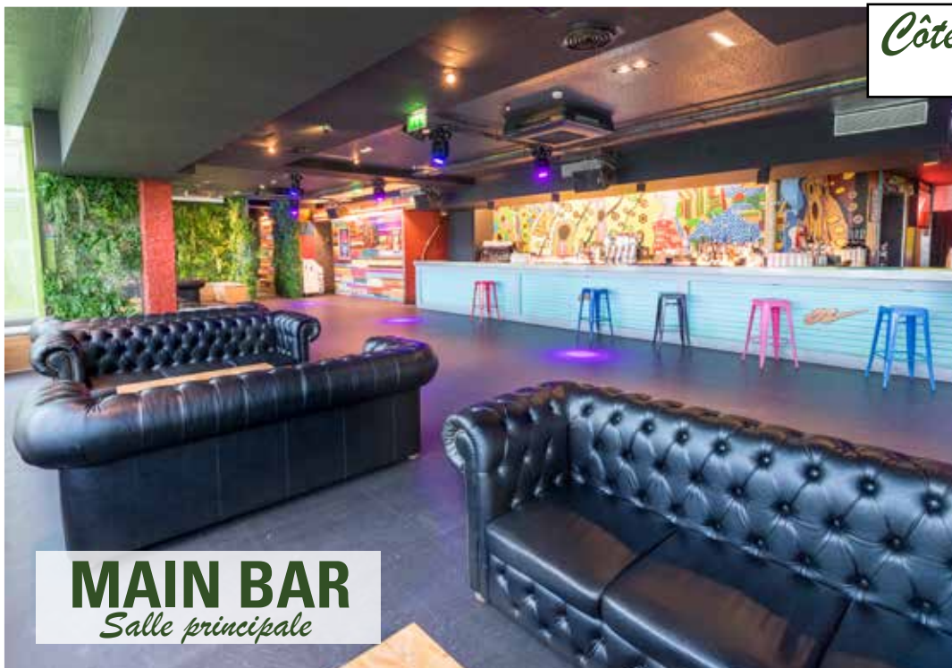
MAIN BAR Salle principale